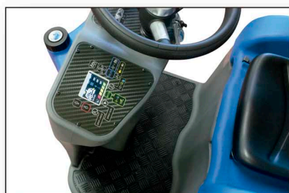
Pannello di controllo digitale con funzione eco Digital control panel with eco function Tableau de bord avec fonction eco