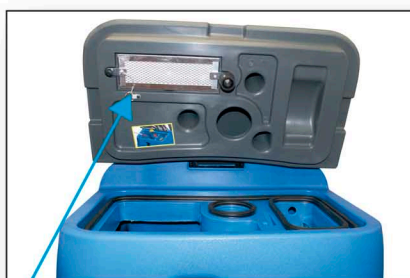
Filtro hepa Hepa filter Filtre hepa